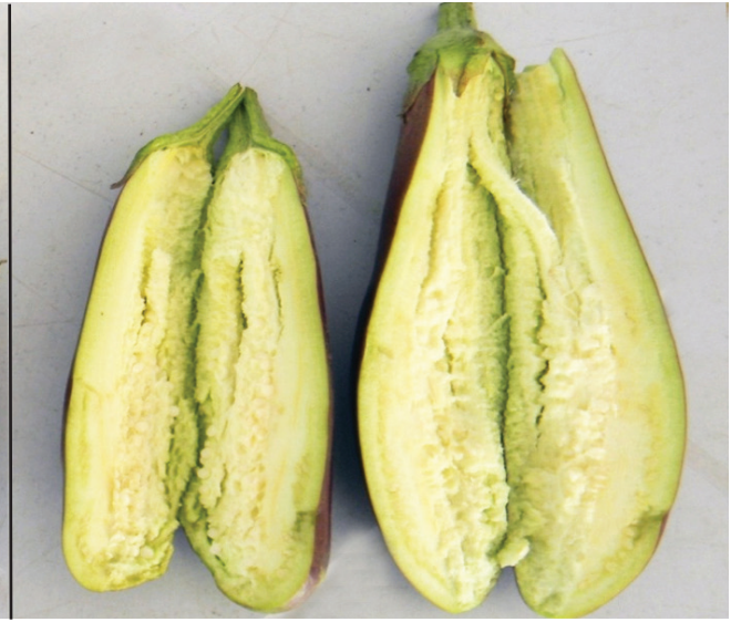
Figure 4. Bt eggplant