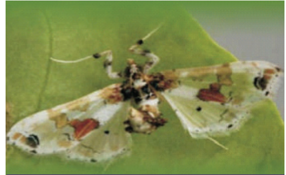
Figure 1. Adult moth

Aron masulbad ang problema, daghan sa mga magtatanum ug talong sa mga dagkong tanuman sa Pilipinas ug sa Bangladesh, mag-spray ug kemikal na pamatay sa insekto kada usa kaadlaw, hangtod sa 80 kabeses sa usa ka nagtubo na panahon. Kini nga hinimoan, dili ni madawat ug dili pud maayo para sa kahimsog sa mga mamalit, mag-uuma ug sa kaliponan. Sa Pilipinas, itunlob pa ang bunga sa talong sa sinagol na kemikals aron makasigurado na ang mga bunga mabaligya. Sa India, ang mga magtatanum ug talong mag-spray 20-40 kahigayon kada nagtubo na panahon, kay kon dili ni himoon, wala sila maani.