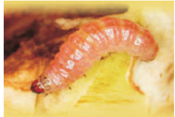
Figure 2. Larvae