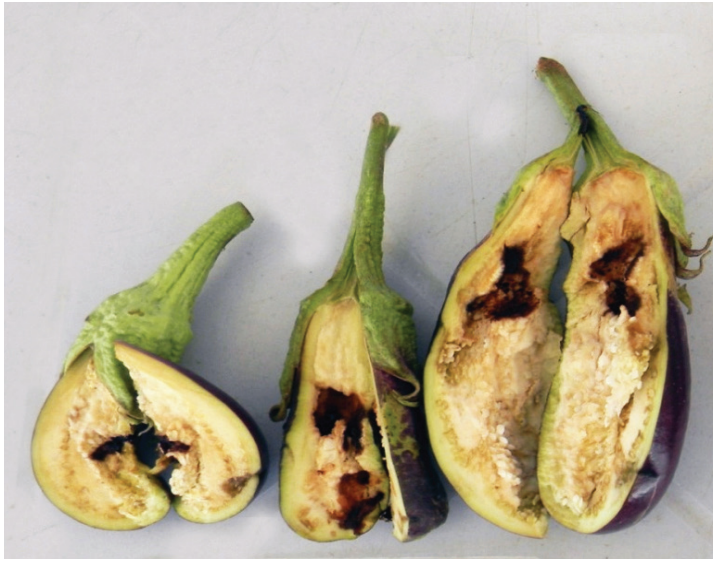
Figure 3. Non-Bt eggplant

Ang buot pasabot sa Bt ay Bacillus thuringiensis , usa ka klase nga bakterya na daghan sa yuta, ug gapatungha ug protina na makadaot sa FSB. Gisulod na sa mga siyentista ang gene nga mohimo ani nga protina sa talong nga makahatag ug resistensya kontra sa FSB.